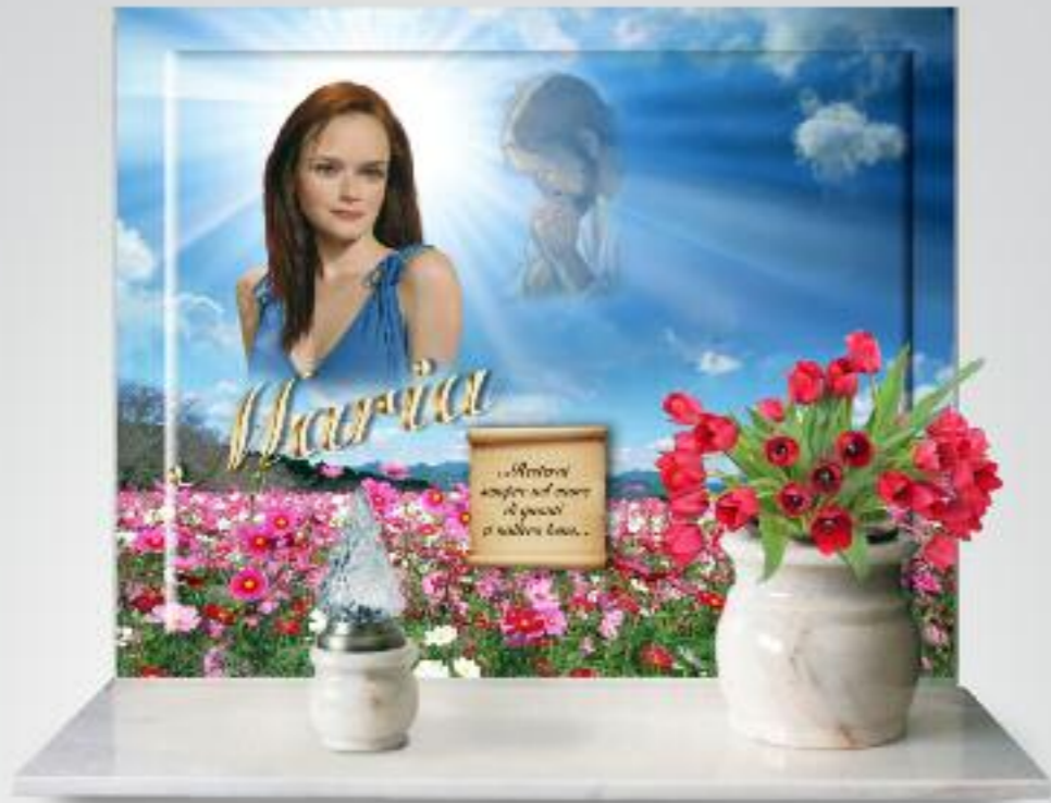
variante cristo / madonna