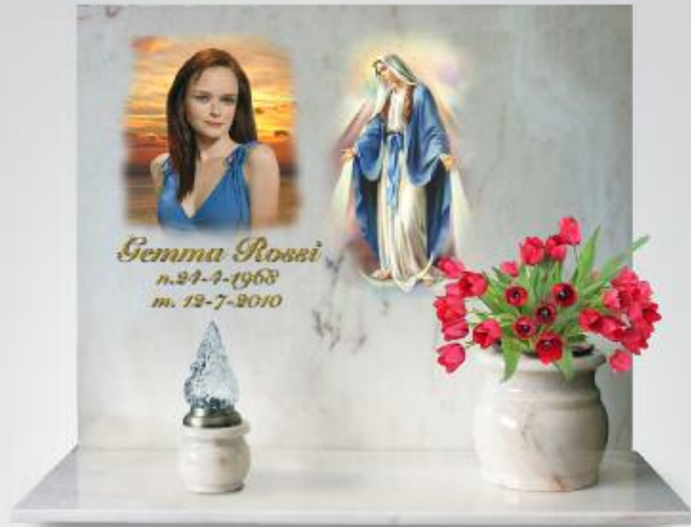
variante cristo / madonna