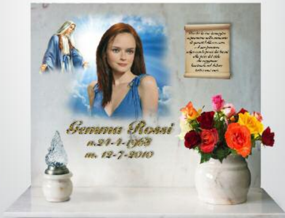
variante cristo / madonna LC 102