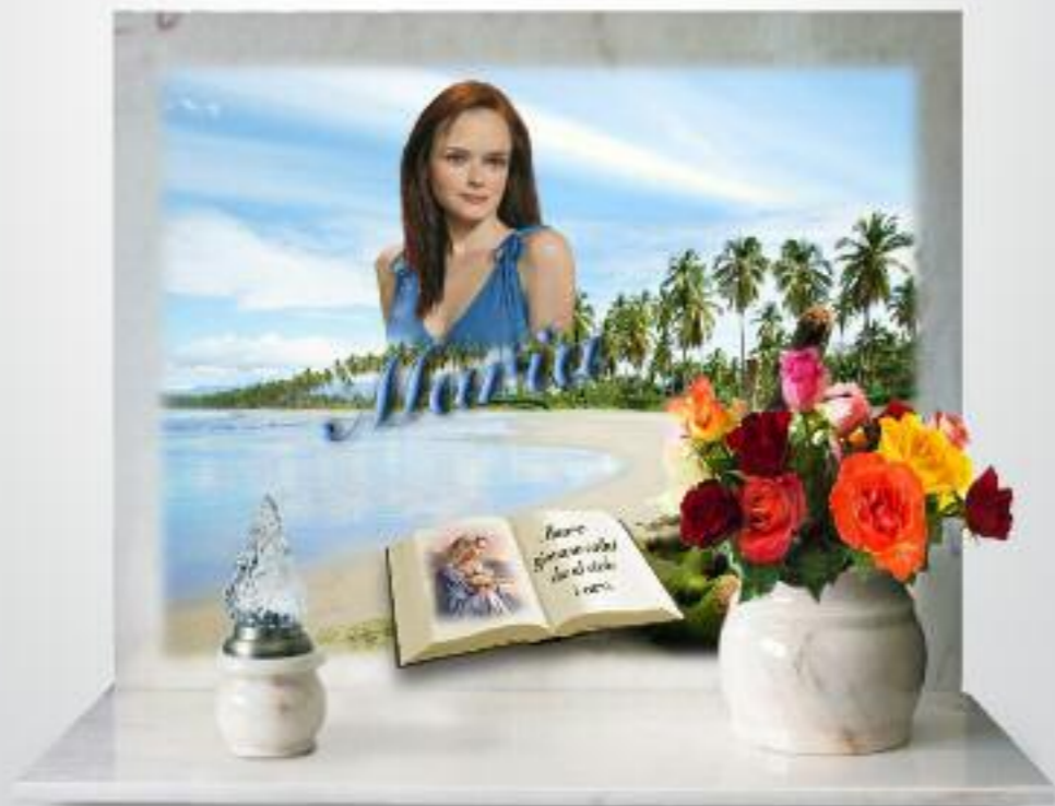
variante cristo / madonna