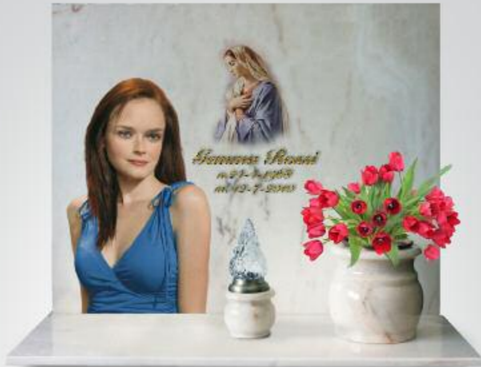
variante cristo / madonna LC 101