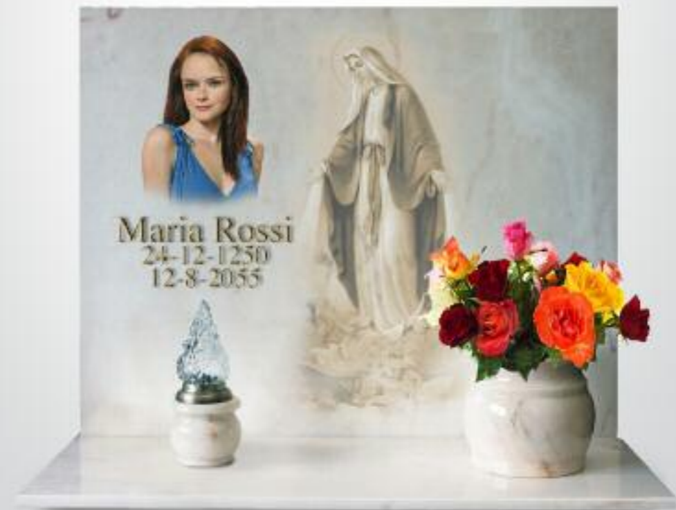
variante cristo / madonna